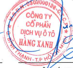
ĐỖ TIẾN DŨNG