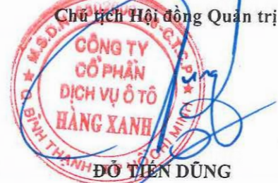
ĐỖ TIẾN DŨNG

Báo cáo này được đọc kèm với thuyết minh báo cáo tài chính (hợp nhất)